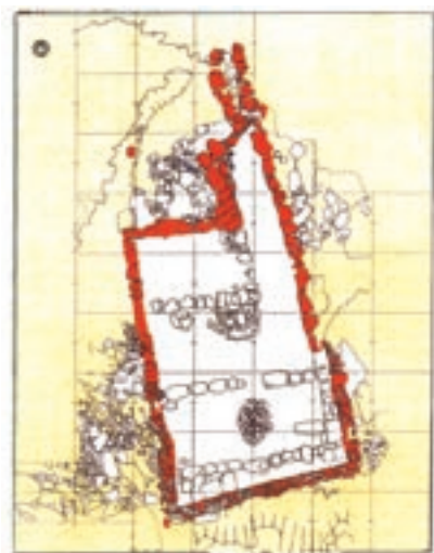
SITO DI CASTEL RAIMONDO, RILIEVO PLANIMETRICO DELLA "GRANDE CASA" PREROMANA