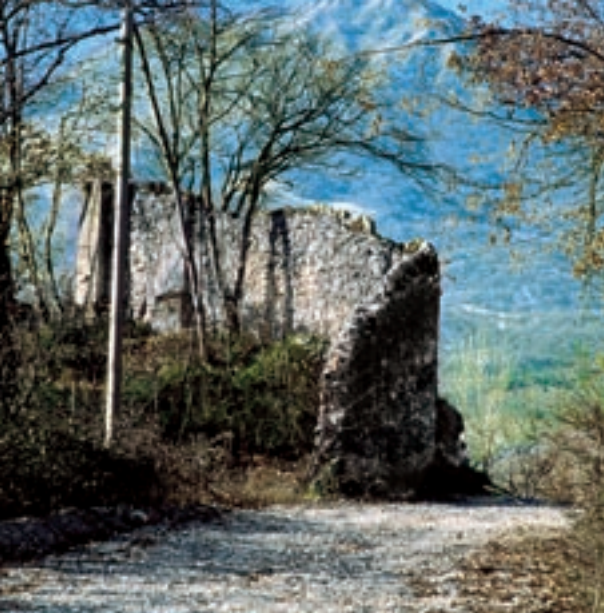
FOTO - RESTI DELLE MURA DEL CASTELLO DI MONTEREALE (MONTEREALE VALCELLINA)