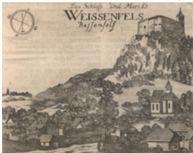
FOTO - WEISSENFELS, STAMPA DEL LIBRO J.W. VALVASOR 1689 FUSINE IN VALROMANA (TARVISIO)

Il viaggio in cui ci guida Virgilio, infatti, non mira solamente a una fruizione turi-