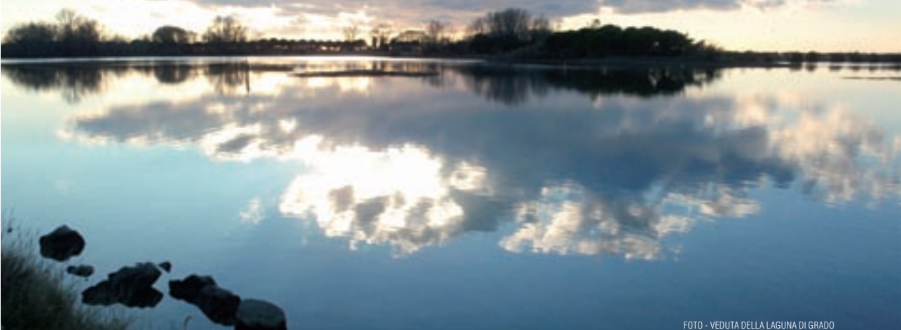
FOTO - VEDUTA DELLA LAGUNA DI GRADO

mativo. Suddivisi in 5 itinerari attraverso la regione, i castelli del Friuli Venezia Giulia vengono presentati con la loro storia, le caratteristiche principali e le indicazioni per raggiungerli. Non bisogna dimenticare, tuttavia, che gran parte delle opere fortificate oggi dismesse o in stato di abbandono sono situate in luoghi raggiungibili con sentieri di montagna a volte anche impervi e pericolosi ed è quindi necessario affrontare gli itinerari proposti con la massima cautela e con il rispetto dovuto a un ambiente naturale che il più delle volte ha ripreso il sopravvento sulle antiche pietre.