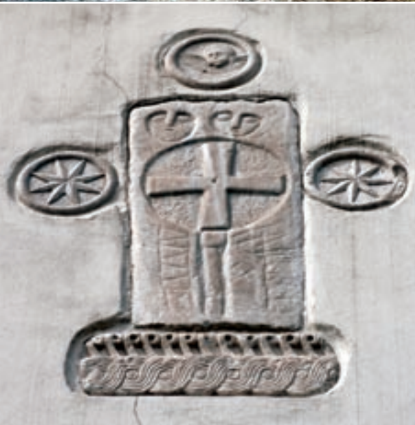
FOTO - PIETRA TOMBALE DI ORIGINE LONGOBARDA POSTA SULLA FACCIA DELLA BEATA VERGINE ASSUNTA DI BASAGLIAPENTA (BASILIANO)